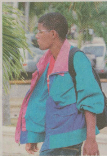
Las temperaturas seguirán bajas.

Para Santo Domingo se pronostica un cielo medio nublado con lluvias ligeras.