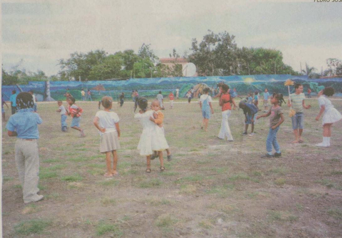
Niños juegan donde estuvo la planta contaminadora.

La planta de reciclaje de baterías Metaloxsa fue clausurada en 1999. Se estima que con el plomo se afectó